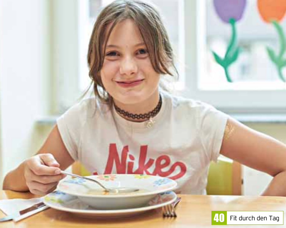
40 Fit durch den Tag