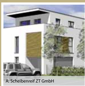
A: Scheibdenreith ZT GmbH