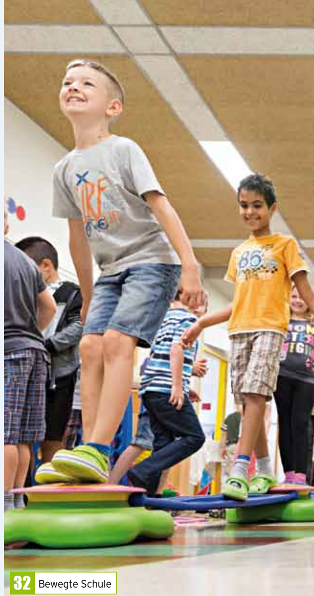
32 Bewegte Schule