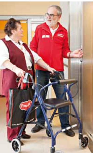
Mobile Dienste wie Volkshilfe, Hilfswerk, Caritas oder Rotes Kreuz bieten Unterstützung an. Auch Agenturen können helfen, die optimale Betreuung zu finden (siehe Beitrag Seite 24).